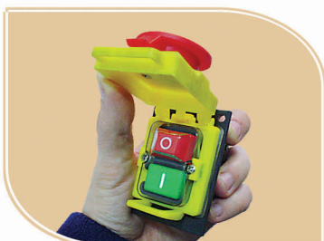
Llave interruptora con Parada de Emergencia.