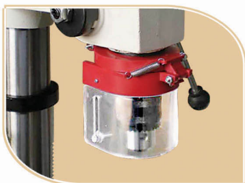
Protector visual telescópico.