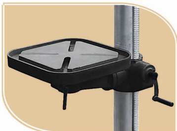
Sistema de Elevación de Mesa con Cremallera.

Post Drill and Bench Drill / Furadeiras de Coluna e Bancada